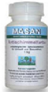
naravna bela barva