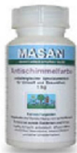
naravna bela barva